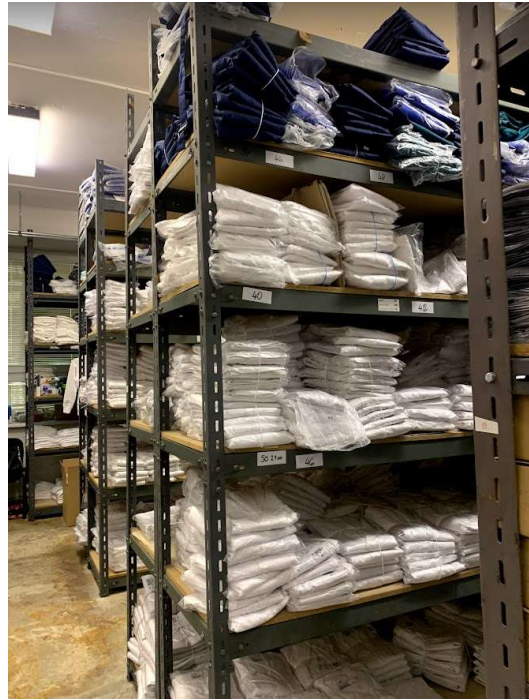
Obrázek 8: Skladování