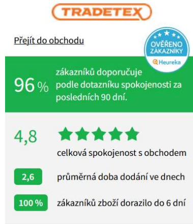
Obrázek 1: Hodnocení zákazníky