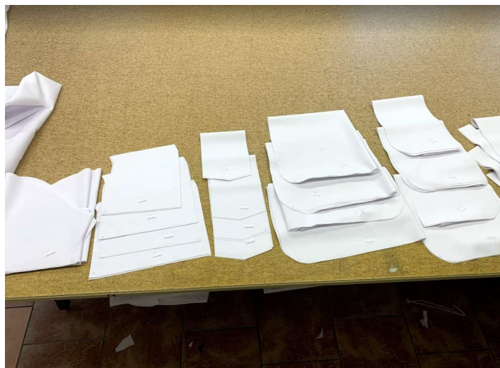
Obrázek 5: Střih