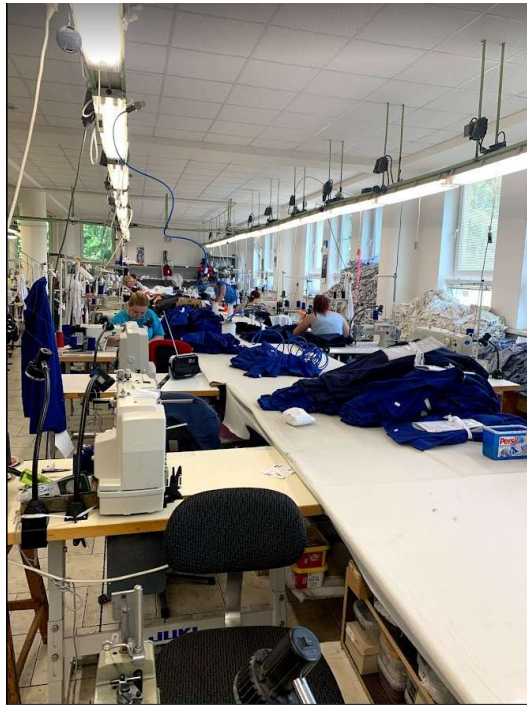
Obrázek 6: Produkce