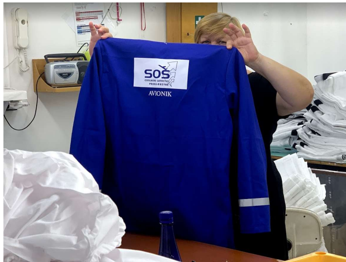
Obrázek 7: Hotový produkt