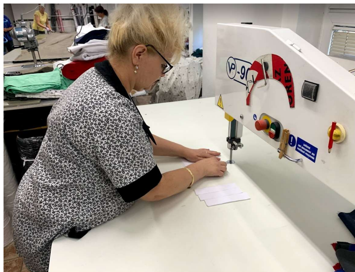
Obrázek 4: Řez tkaniny dle návrhu střihu